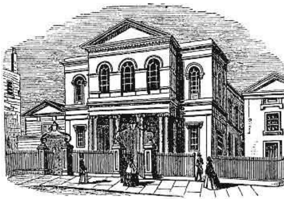
New Park Street Chapel, at the time Charles Haddon Spurgeon commenced his pastorate there.

Dr. J. Gill noemde de kinderdoop een part en pilaar van de roomse kerk. Hij werd gevraagd dit te bewijzen, of te herroepen. Hier volgt een vertaling van de voornaamste punten uit zijn antwoord: