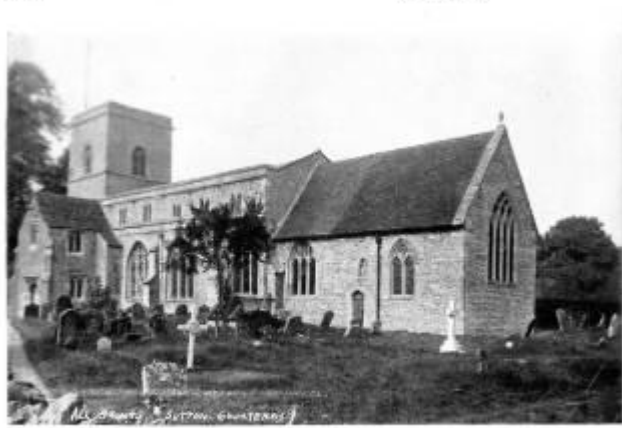
SUTTON COURTNEY CHURCH.