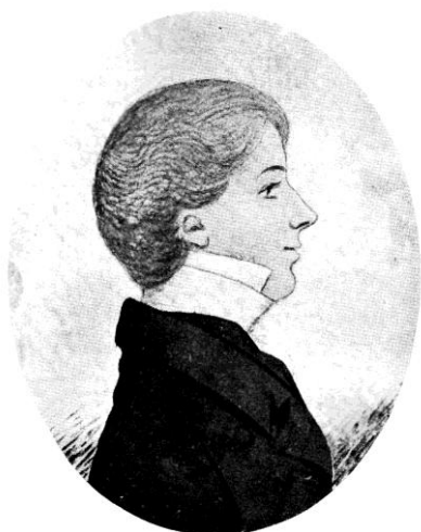
WILLIAM TIPTAFT (1803—1864). (As an undergraduate, from a miniature.)