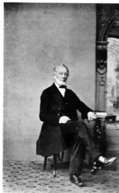
WILLIAM TOMBLIN KEAL, M.D. (1792—1874).