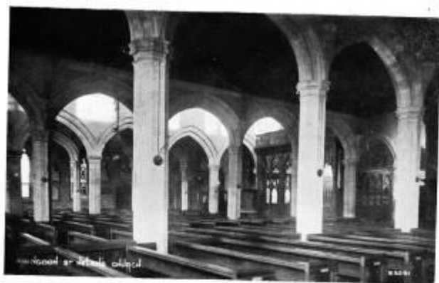
ABINGDON GREAT CHURCH.