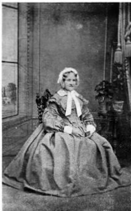
DEBORAH WARD KEAL (1791—1871).