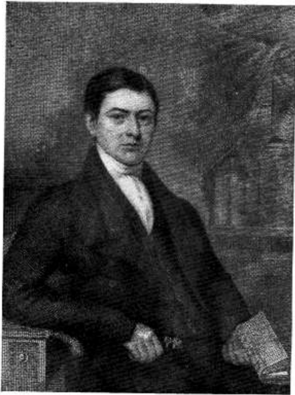
HENRY FOWLER (1779—1838).

Minister at Gower Street Chapel (1820—1838).